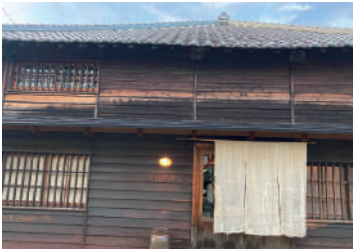
八女の地酒 薬樹を取り扱う酒屋さん