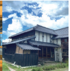
旧八女郡役所に併設