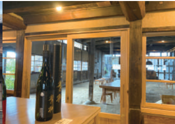
店内から「大きなホール」がみえる